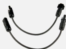
PV-Adapterset SUNCLIX-MC4 (Z360H)