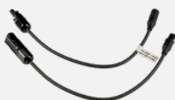
PV-Adapterset MC3-MC4 (Z360K)