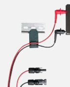
Magnetische Messspitzen mit MC4-Stecker (Z502Y)