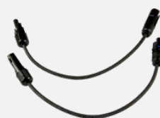
PV-Adapterset TYCO-MC4 (Z360J)