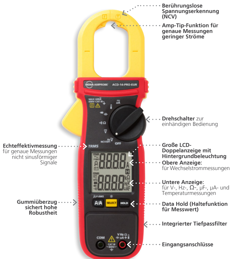
ACD-14-PRO-EUR Echtheffektiv-Strommesszange bis 600 A mit Doppelanzeige