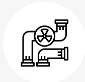
Wasser, Abwasser und Kanalisation