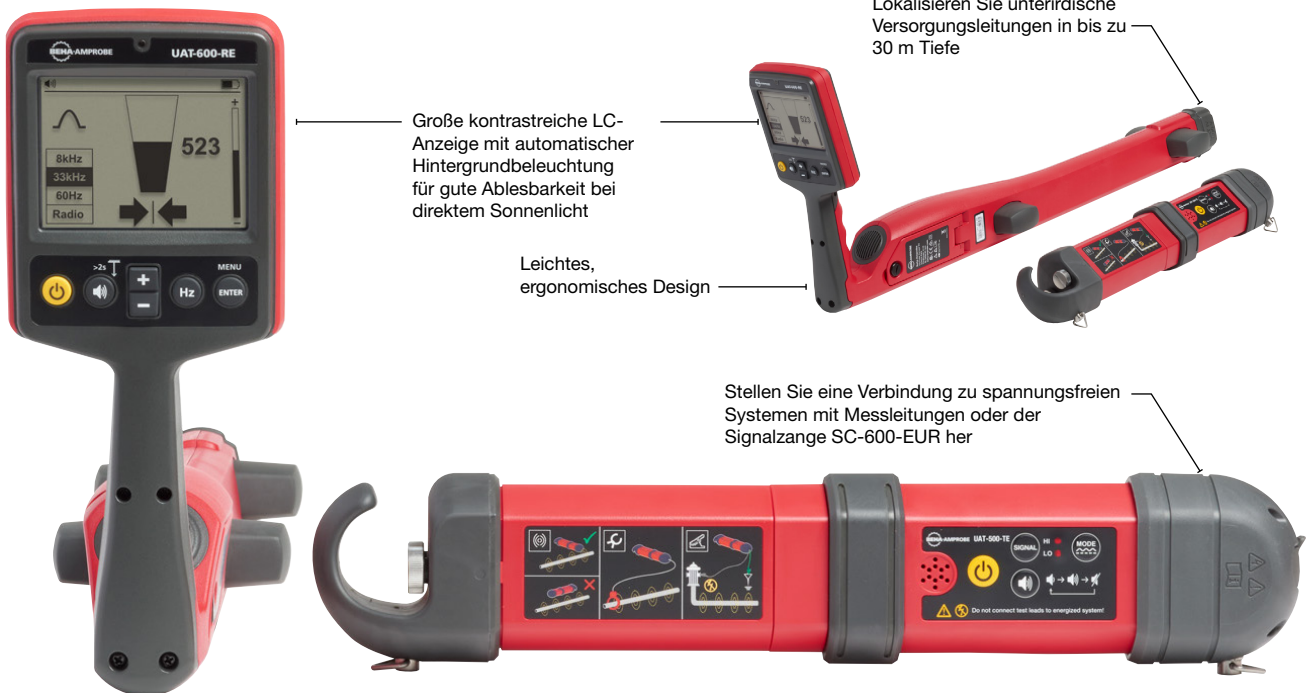
UAT-505-EUR Leitungssucherset zur Ortung unterirdischer Versorgungsleitungen