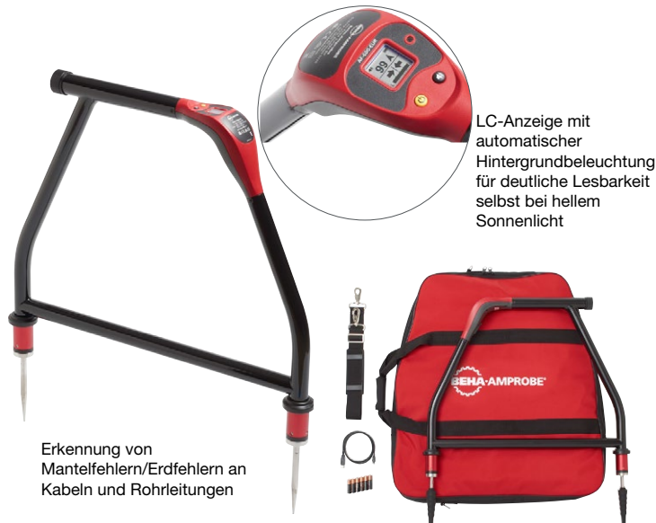
Erkennung von Mantelfehlern/Erdfehlern an Kabeln und Rohrleitungen

AF-600-EUR A-Rahmen zur Mantelfehlerortung, UAT-600-TE Sender, SC-600-EUR Signalzange, TL-600-25M Verlängerungsmessleitung