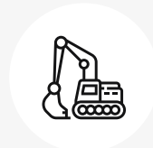
Wartung von Anlagen im Freien