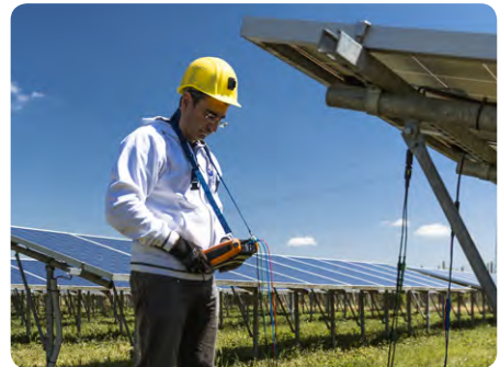
Eine einzige Person kann die Messung durchführen.