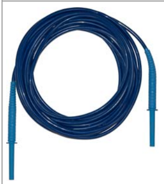
Messleitung MCABLE-10m-blue (Z555R)