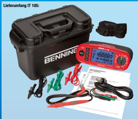
Lieferumfang IT 105: