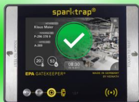
Grüne Signalisierung bei „gut“ Messung

Ein rückseitiger Lichtschein in rot oder grün, der das Ergebnis einer Messung visuell auf die Befestigungsfläche projiziert, wird von Leistungs-Leuchtdioden abgestrahlt.