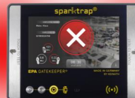
Rote Signalisierung bei „schlecht“ Messung