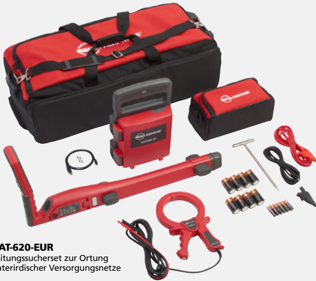
UAT-620-EUR Leitungssucherset zur Ortung unterirdischer Versorgungsnetze