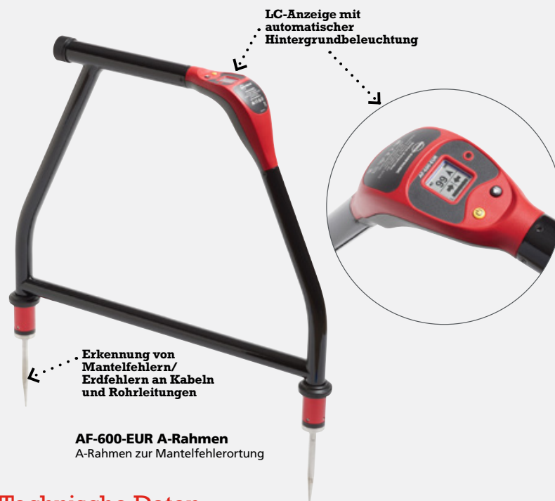
AF-600-EUR A-Rahmen A-Rahmen zur Mantelfehlerortung

Richten Sie den Sender UAT-600-TE ein, um ein Suchsignal in das zu prüfende Versorgungsnetz einzuspeisen. Der A-Rahmen AF-600-EUR empfängt das Signal und lokalisiert/ortet die Fehlerstelle. Der A-Rahmen AF-600 lokalisiert die Position, an der ein metallischer Leiter (entweder die Ummantelung oder ein metallischer Leiter des Kabels) den Erdboden berührt. Er kann außerdem andere Fehler zwischen Leitern und Erde, wie Beschichtungsmängel von Rohrleitungen, erkennen.