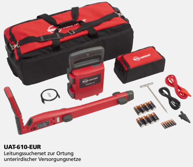
UAT-610-EUR Leitungssucherset zur Ortung unterirdischer Versorgungsnetze