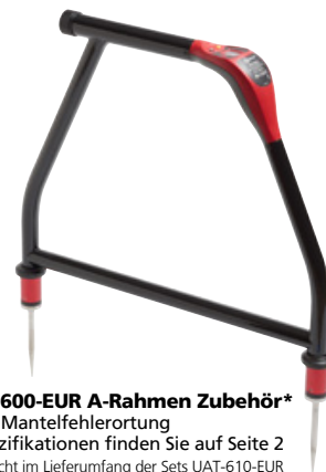
AF-600-EUR A-Rahmen Zubehör* Zur Mantelfehlerortung Spezifikationen finden Sie auf Seite 2 * (Nicht im Lieferumfang der Sets UAT-610-EUR und UAT-620-EUR enthalten)