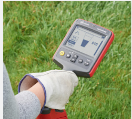
Der kontrastreiche LED-Bildschirm des Empfängers ist auch bei voller Sonneneinstrahlung gut ablesbar