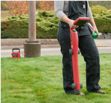
Verfolgen einer einzelnen Versorgungsleitung durch direkten Anschluss der Messleitungen an den Sender