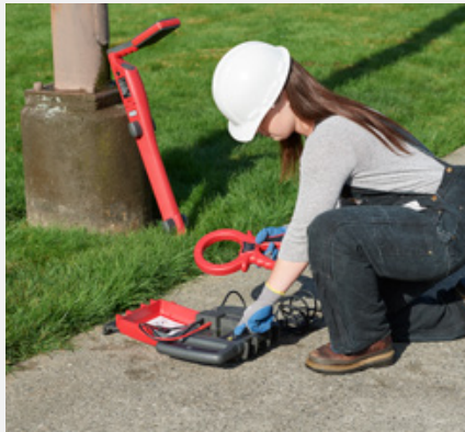
Der Sender ändert entsprechend dem eingesteckten Zubehör, automatisch die Modi