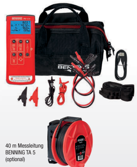
40 m Messleitung BENNING TA 5 (optional)