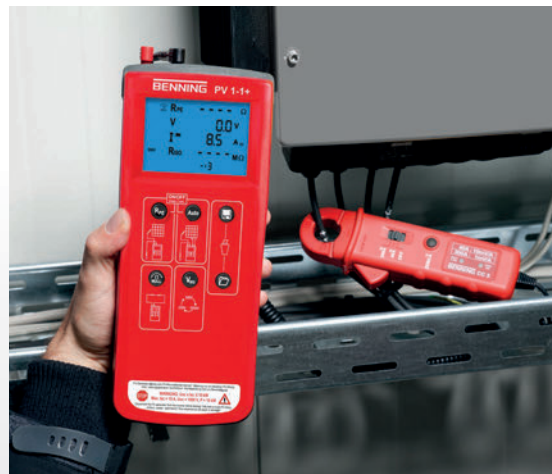
DC-Betriebsstrommessung mit BENNING CC 3