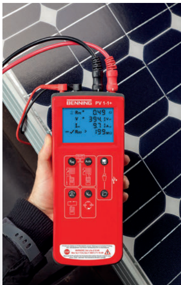
Automessung am PV-Strang (Uoc, Isc, Riso)