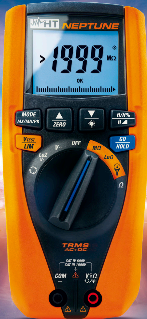
NEPTUNE Art.-Nr.: 1010830